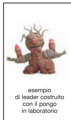
esempio di leader costruito con il pongo in laboratorio