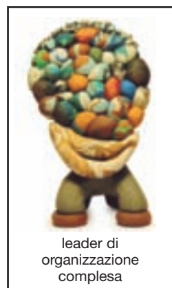
leader di organizzazione complessa

Ecco alcuni esempi creati in laboratorio: