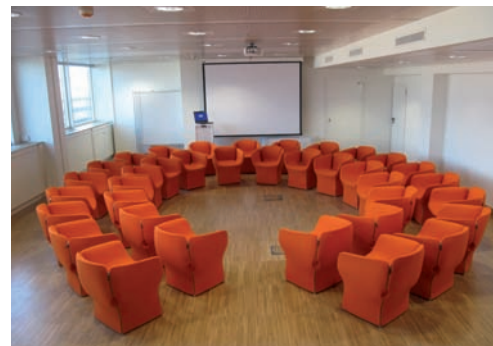
B/loft Intesa Sanpaolo